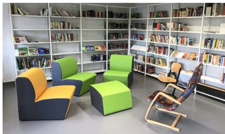
Ein Platz zum Lesen, Lernen, Ausruhen und für schulische Gemeinschaft: Das neue Bibliotheks- und Medienzentrum im ersten Obergeschoss.