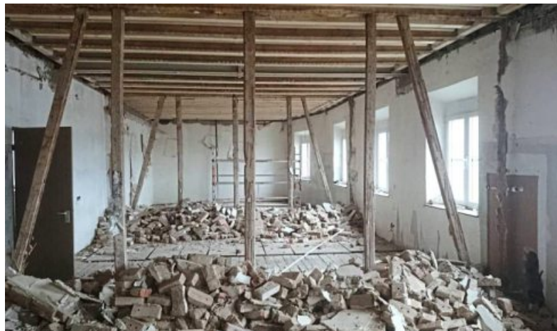
Aus Alt mach Neu: Bei den Umbauarbeiten im Südflügel gab es einiges zu tun. Doch dank effizienter Planung und guter Arbeit können die Schüler nun etliche weitere Klassenzimmer und Seminarräume nutzen. Die hell gestalteten Räume sind inzwischen auch mit modernster Technik für optimalen Unterricht ausgestattet.