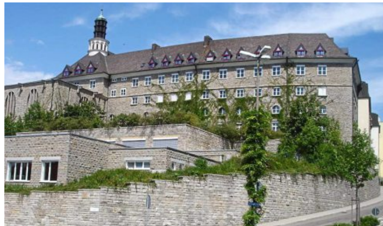
Im Südflügel des Altbaus im St. Paulusheim stehen dem Gymnasium inzwischen neue Zimmer zur Verfügung. Die Aussicht über Bruchsal ist ein weiterer Bonus.